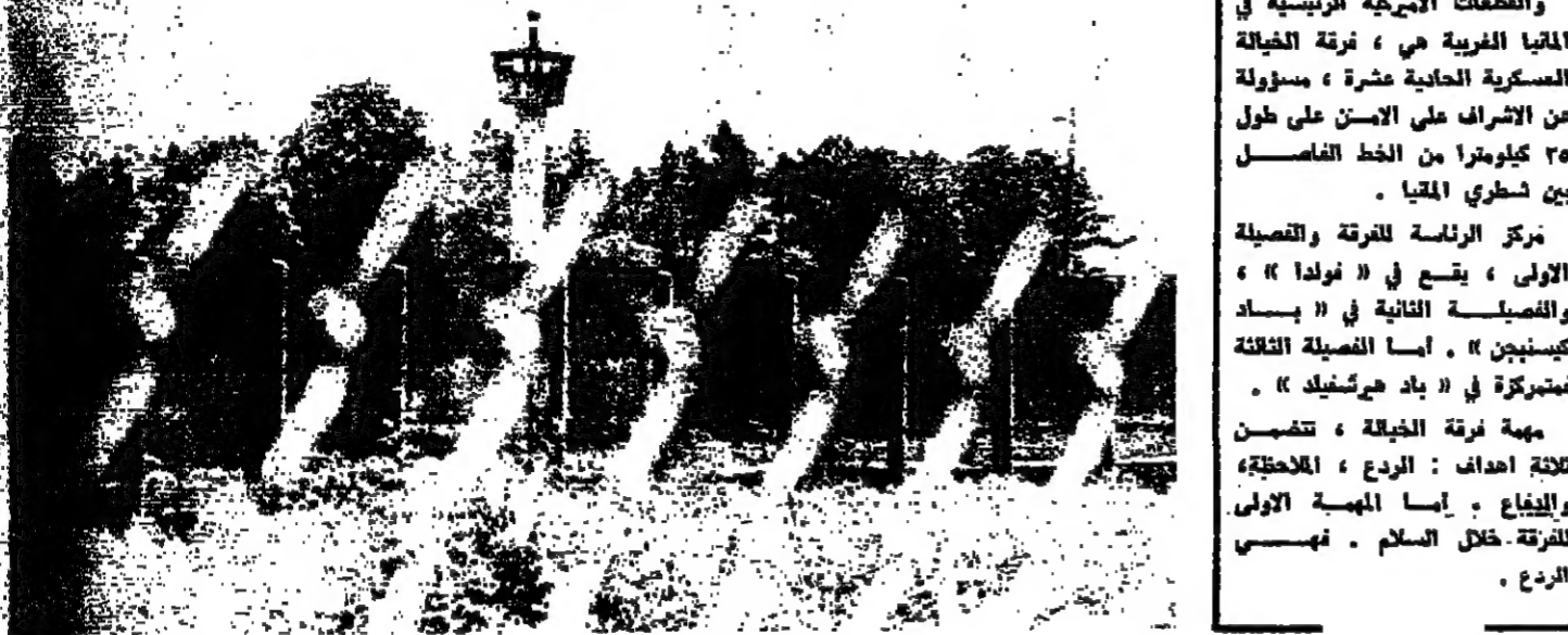
الحائط ، والسلاك الشائكة التي تحمل الالغبيين